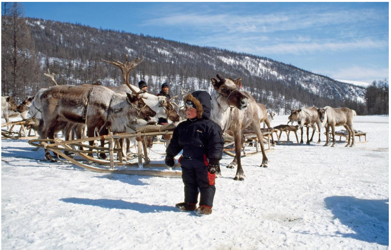
Evenkit elävät taigalla eli Siperian metsävyöhykkeellä poropaimentolaisina. Viime vuosina heidän perinnealueitaan ovat

Venäläiset tunkeutuivat Siperiaan 1500-luvulta alkaen. Toisin kuin Pohjois-Amerikan arktisella alueella, paikannimistöä ei pääosin muutettu, joten alkuperäinen nimistö on edelleen osittain säilynyt. Venäläiset kiinnostuivat Siperian suurista joista, kuten Obista, Lenasta ja Kolymasta kauppaa- ja turkisreitteinä. Lisäksi valtakunnan laajentaminen kohti Tyyntämerta 1700- ja 1800-luvulla oli osa aikansa valtopolitiikkaa. Suurimmillaan Venäjä hallitsi Suomesta Alaskaan kattanutta vyöhykettä vuosina 1809-1867. Valtio kantoi raskaita veroja alkuperäiskansojen yhteisöissä ja harjoitti jonkin verran lähetystyötä. Vuonna 1917 Neuvostoliiton perustaminen ja kommunistinen vallankumous muuttivat kaiken Siperiassa ja Venäjän pohjoisessa. Kollektivisointi riisti alkuperäiskansoilta omaehtoiset luontaistalouden edellytykset ja porojen hallinnan. Laajamittaiset teolliset toimet mursivat luonnon tasapainon ja tuhosivat esimerkiksi hantien ja mansien kalavedet ja suuret joet. Kaivokset, öljy ja kaasu, vesivoima ja metsätalous ovat aiheuttaneet mittamattomia ympäristöongelmia halki Siperian. Kuitenkin siellä on paljon luonnontilaista seutua.