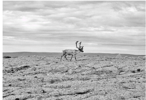
Kuva: Karibu, poron läheinen sukulainen, on gwitchinien pääriistaeläin ja heidän kulttuurinsa keskiössä.

Perinteisesti gwitchinit ovat olleet metsästäjiä. Yhteiskunnan vuotuiskiertoa on pitkälti määritellyt Alaskan ja Kanadan rajalla vaeltava karibu-lauma, jonka perässä heimon perhekunnat vaelsivat. Muita riistaeläimiä ovat olleet hirvi, piisami, majava, metsälinnut ja peurat.