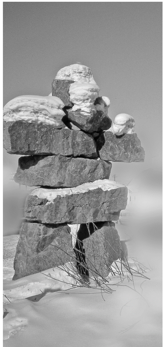
Kuva: Inuitsitit ovat inuiittien rakentamia kivimuodostelmia, joiden tarkoitus vaihtelee. Osa on pyhien paikkojen merkinä, osaa hyödynnettiin karibunpyynnissä perinneaikoina, ja osa viittaa tärkeisiin leiripaikkoihin.

Hylkeenpyynti on edelleenkin inuiiteille merkittävä ruuan ja kulttuurin lähde. Hylkeisiin suhtaudutaan hyvin kunnioittavasti ja eri hyljelajeihin liittyy runsaasti uskomuksia ja tapakäytäntöjä. Hylkeestä käytettiin perinteisinä aikoina kaikki hyödyksi. Hylkeennahka oli vaatteiden ja -varusteiden raaka-aine, traani eli hylkeenrasva paloi lampuissa, jotka