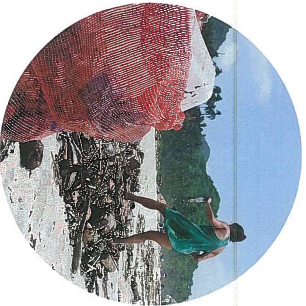
Merentamolta löytyvä muovijäte on vain jäävuoren huippu.