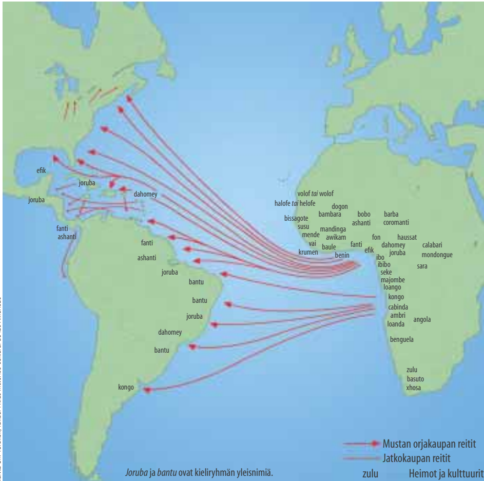
Afrikkalaisten etnisten kulttuuriryhmien kohdemaat.

Espanjan laajoihin Amerikan siirtomaihin tuotiin kaikista orjista vajaat 15 prosenttia, tuon-