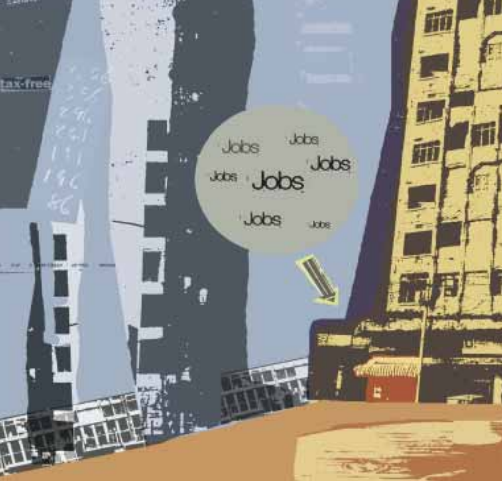
Piirros: Mia Savonien

totekniikan kehittymisen myötä. Projektipäällikkö Hirvosen mukaan tilanteeseen voidaan puuttua parhaiten uusia lainsäädäntöaloitteita kehittämällä sekä toimilla, jotka tehostavat viranomais-ten välistä yhteistyötä.