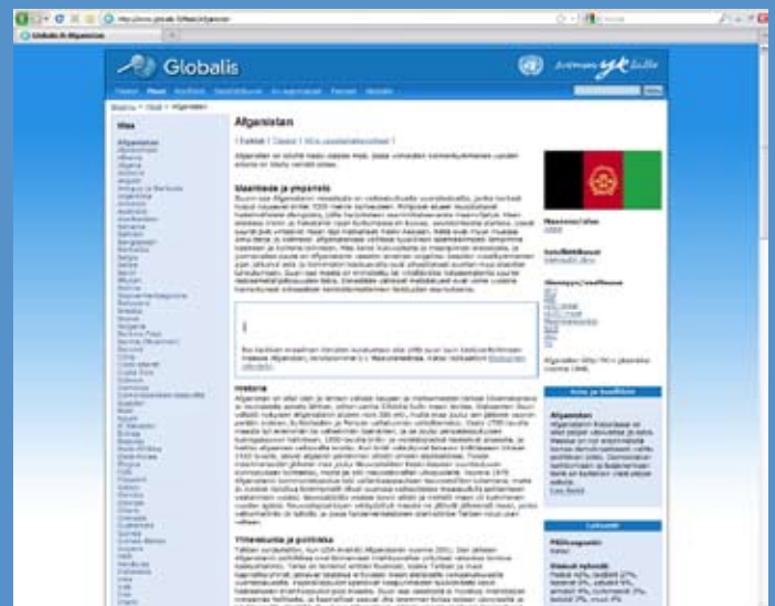
Yksittäisen maan näkymä. Vasemmanpuoleisesta valikosta voit siirtyä suoraan muiden maiden maaprofiileihin.

Vasemmanpuoleisesta valikosta voit tarkastella maita maaryhmittymittäin ja alueittain. Alueet -osiossa maanosat hahmottuvat selvästi pienemmillekin oppilaille. Maaryhmittymistä löytyy yhteenveto merkittävistä kansainvälisistä poliittisista, taloudellisista ja sotilaallisista yhteistyöorganisaatioista.